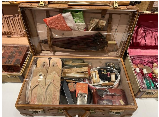
(JICA 横浜海外移住資料館展示「移民の七つ道具」 活動・ユニット案作成者撮影)